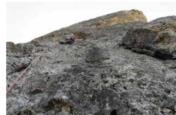
Luca Brigo sul quinto tiro.

Dal rifugio si rientra al Monte Pana per il sent. 525 (1,45 h) o al Passo Sella per il sent. 526 (2,30 h).