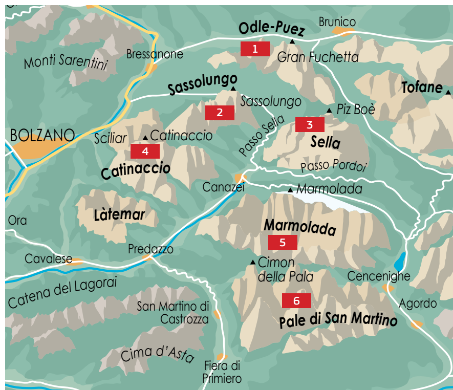
Mapa generale (disegno di Marco Romelli).