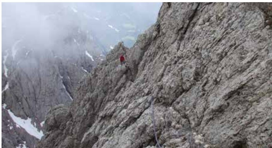
L'uscita dei Diedri di destra sul Sass d'Ortiga.