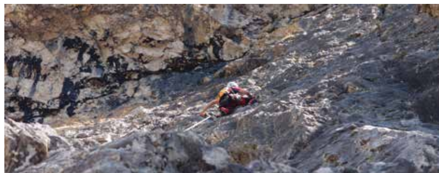
Sulla Via Dibona al Sass Pordoi.