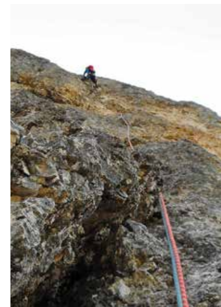
Luca Brigo nella parte centrale della via.